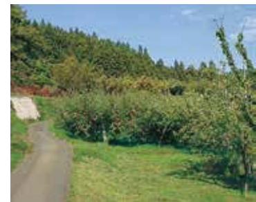
蝶ヶ森ふもとのリンゴ園

●コースの利用方法 バス利用 ・ 起点：岩手県交通 長岡線「東安庭二丁目」下車 ・ 終点：岩手県交通 中央線「たたら山」乗車